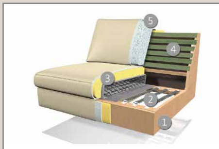
Das Design des hier abgebildeten Querschnitts entspricht nicht dem Modell dieses Katalogblattes.