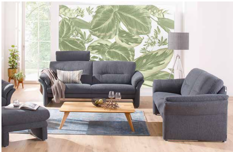
Bezug: W77/28 dark blue