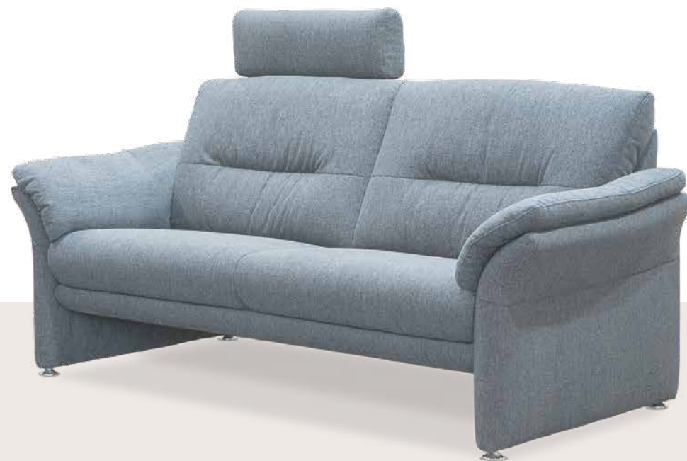
Bezug: W77/28 dark blue

Dieses Modell fällt auf durch Eleganz und harmonische Formgebung - insbesondere bei den markanten, geschwungenen Armteilen inklusive bequemem Auflagekissen. Wählen Sie zwischen dem unvergleichlichen Sitzkomfort Basic und dem ebenso super bequemen Sitzkomfort Soft, wenn Sie lieber weich sitzen. Eine Kontrastfadenverarbeitung ist möglich.