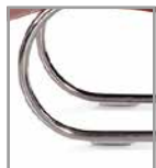
Freischwingerstuhl Chrom glänzend