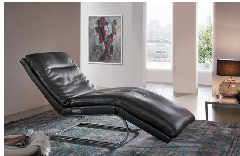
Bezug: Z73/99 nachtschwarz