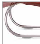
Freischwingerstuhl silber pulverbesch.