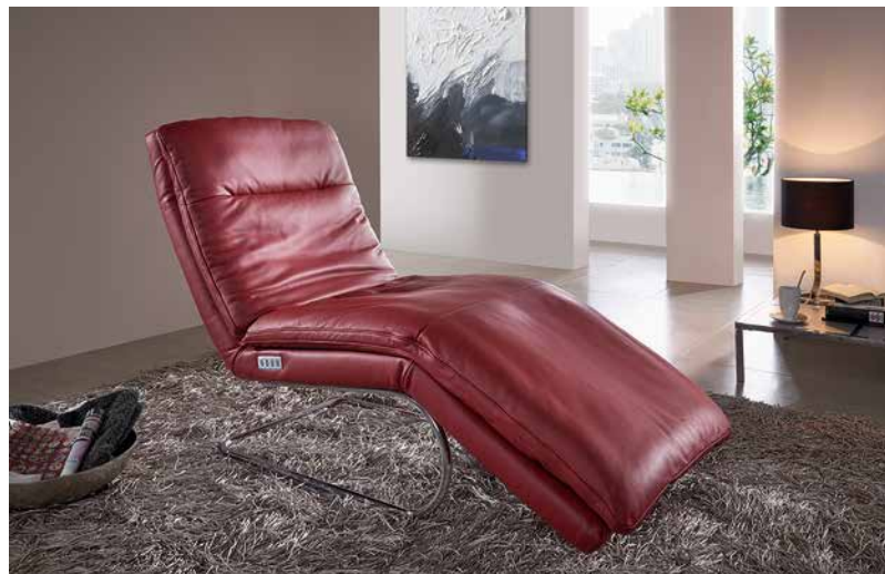
Bezug: Z73/11 ruby red