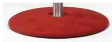
Drehteller bezogen (bei Leder sind aus technischen Gründen Nähte im Bezug)