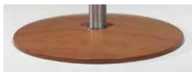
Drehteller aus Holz